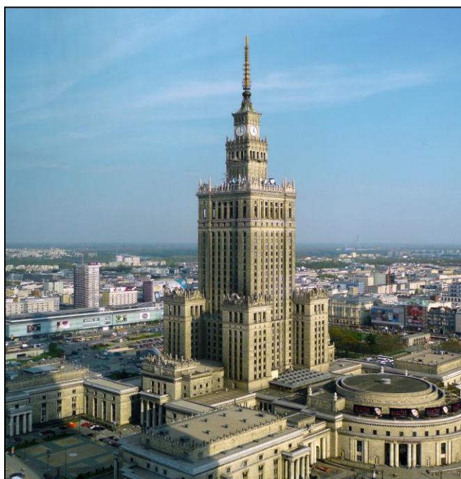
PAŁAC KULTURY I NAUKI