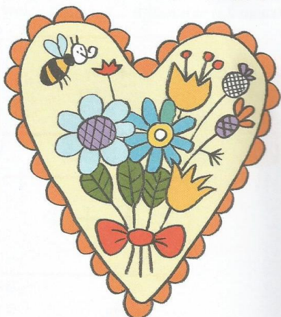
serce dla Mamy