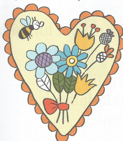
serce dla Taty