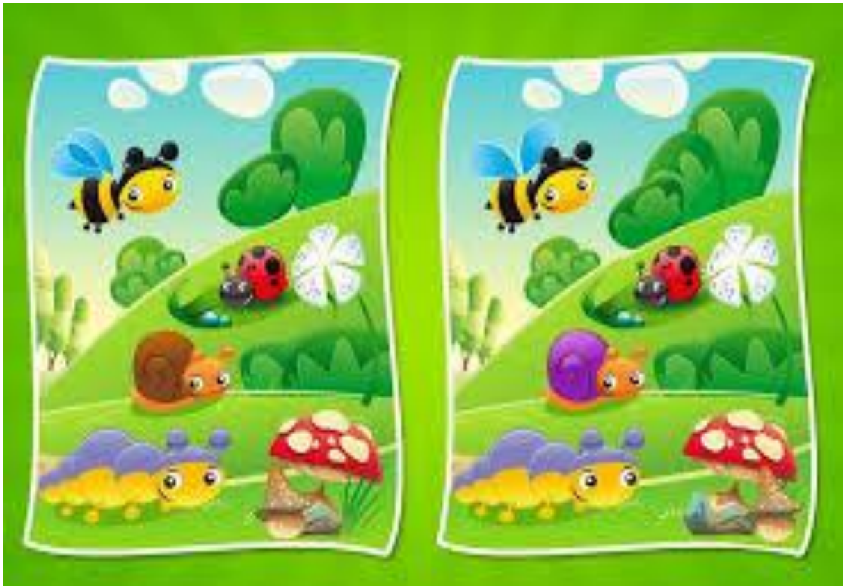
Opracowała: Angelika Kruk